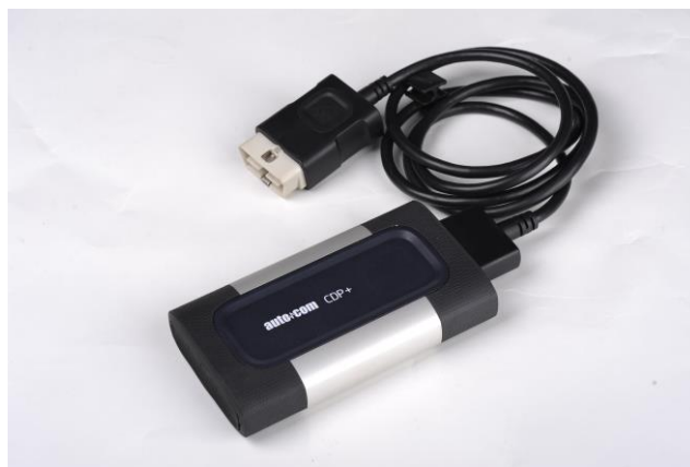
Диагностический мультиплексор AUTOCOM CDP +

Компания «КВАТРО» выражает Вам свое почтение и предлагает сканер AUTOCOM CDP+ для диагностики автобусов, грузовых автомобилей MERCEDES BENZ, MAN, SCANIA, VOLVO, DAF, RENAULT, IVECO , прицепов WABCO, KNORR, HALDEX , а также легких коммерческих автомобилей азиатских, европейских и американских производителей.