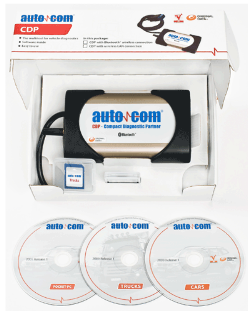
Рис. 2 Бюджетный вариант.