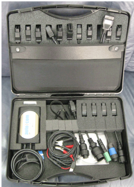
Рис. 1 Полный комплект.

Компания «КВАТРО» выражает Вам свое почтение и предлагает сканер AUTO-COM для диагностики автобусов и грузовых автомобилей MERCEDES BENZ, MAN, SCANIA, VOLVO, DAF, RENAULT, IVECO , прицепов WABCO, KNORR, HALDEX , а также легких коммерческих автомобилей азиатских, европейских и американских производителей.